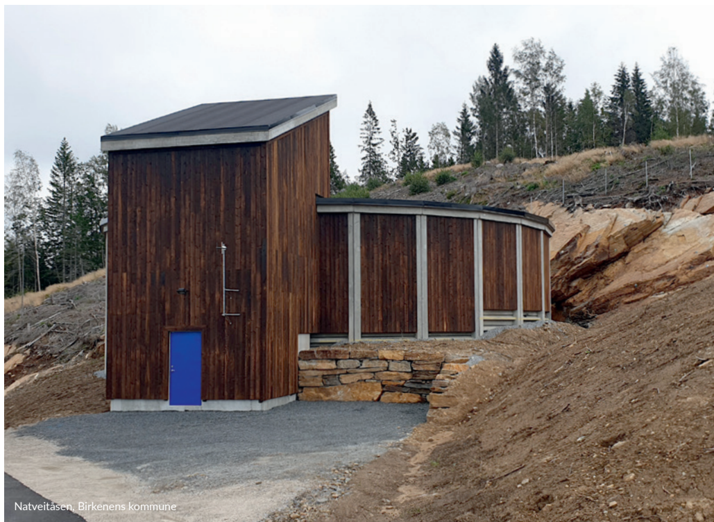
Natveitåsen, Birkenens kommune