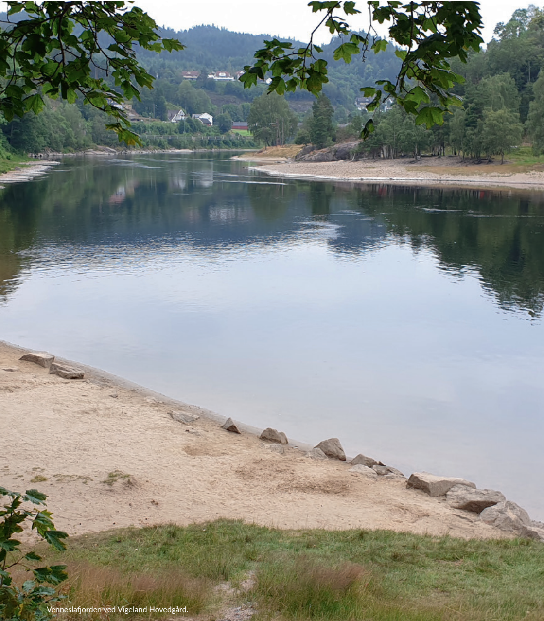
Venneslafjorden ved Vigeland Hovedgård.