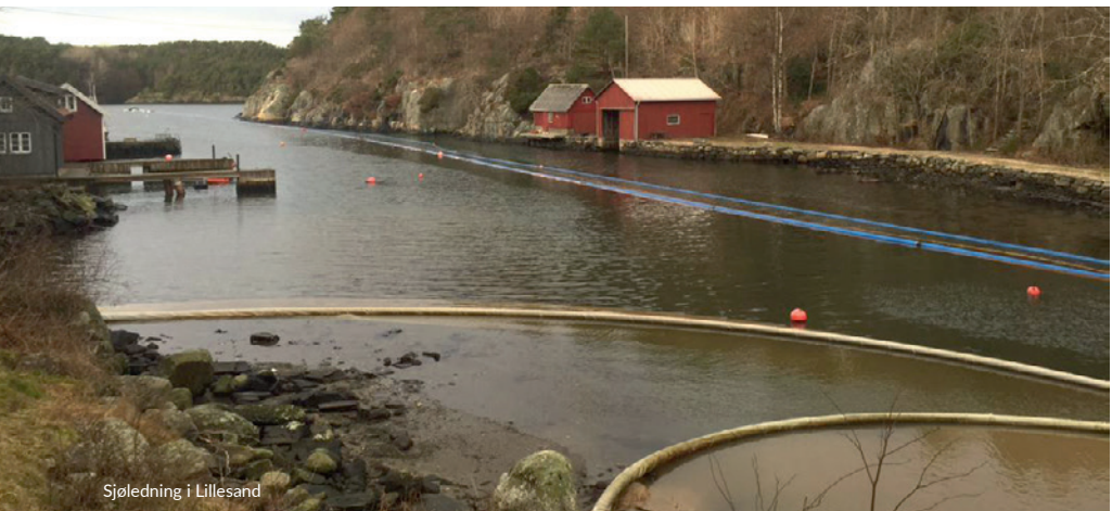
Sjøledning i Lillesand