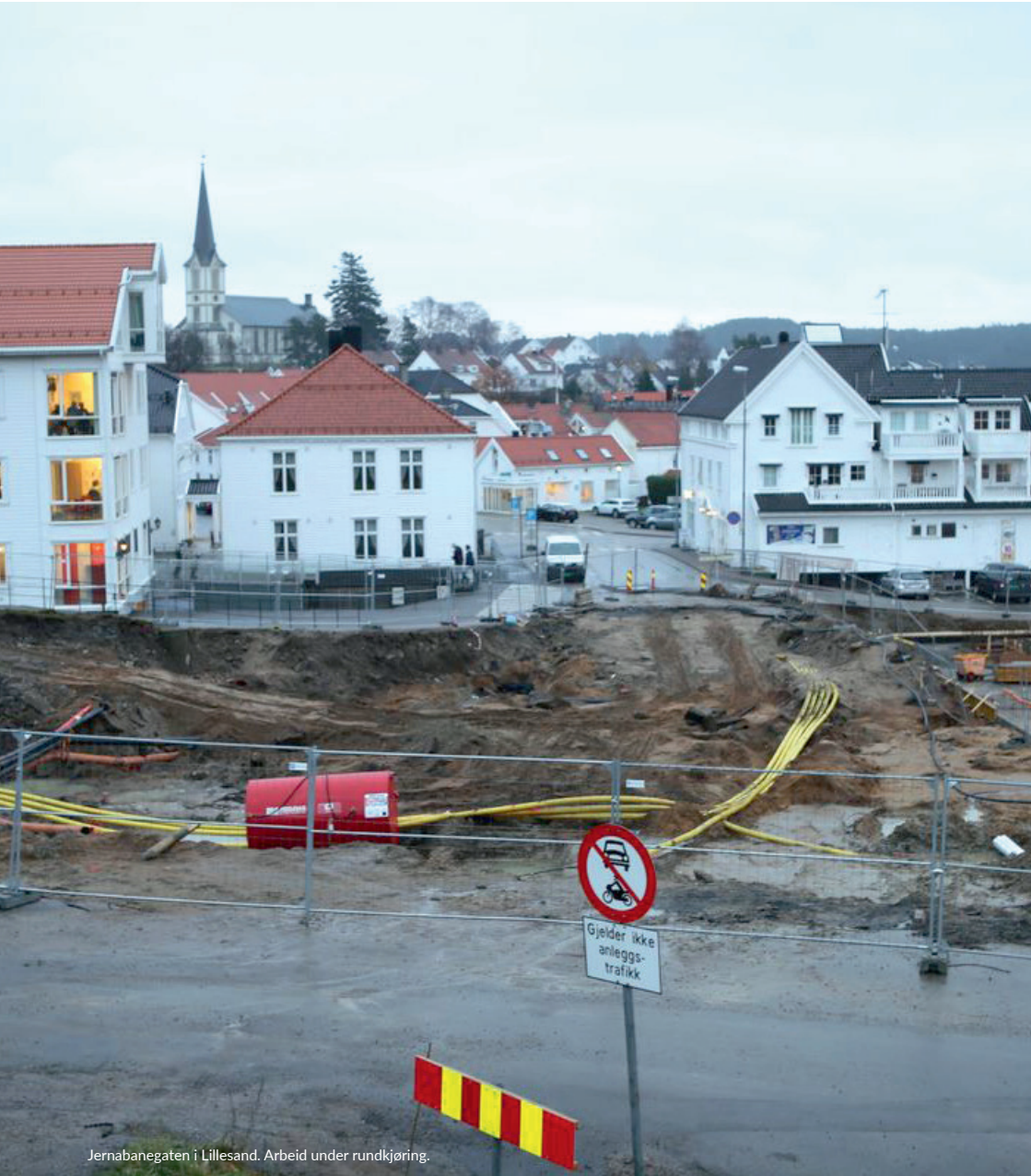
Jernbanegaten i Lillesand. Arbeid under rundkjøring.