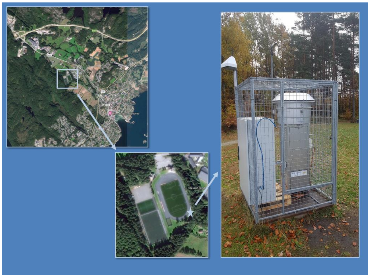
Figur 1 plassering av målestasjonen i holta